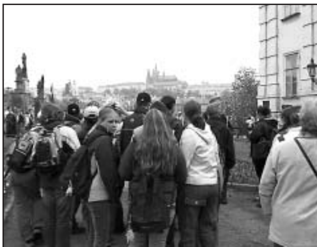
□ Středeční výlet do Prahy.

Přesný termín ještě není stanoven, ale nejspíše do Německa pojedeme v posledním týdnu října v období podzimních prázdnin. Program je ve stádiu příprav a pracuje se na něm hlavně německá strana. Děti i já se necháme překvapit tím, co pro nás naši přátelé přichystají.