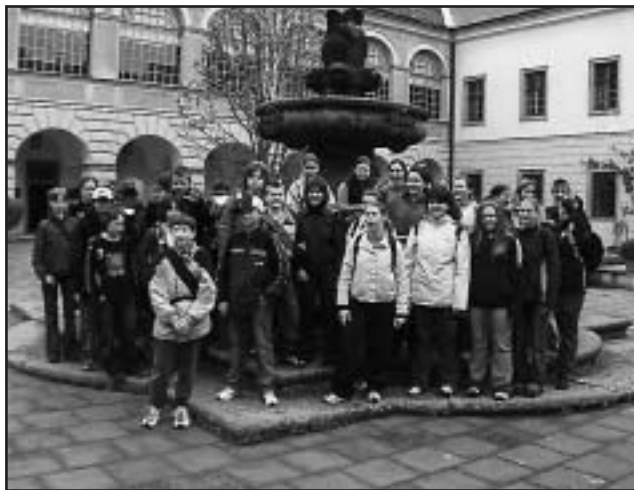
□ Česko-německá výprava na zámeckém nádvoří v Častolovicích.