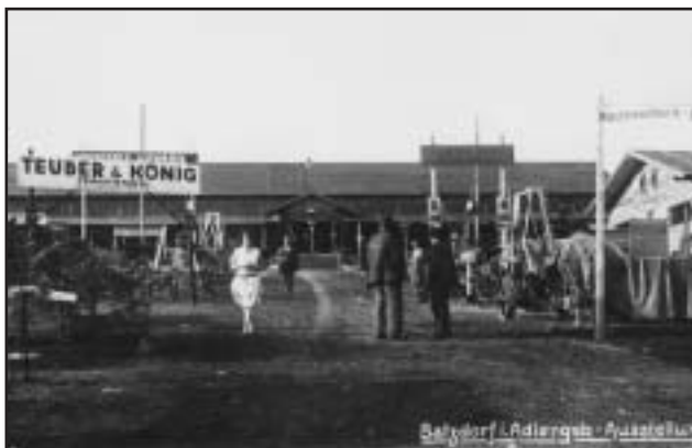
□ Dobová fotografie z "Výstavy pro řemesla, zemědělství, domácí práce" v Bartošovicích 1929.