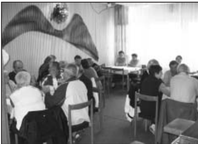
MĚSTO ROKYTNICE V O.H. USPOŘÁDALO VE ČTVRTEK 17.5.2007 OD 17,30 hod. POSEZENÍ S ŽIVOU HUDBOU NEJEN PRO SENIORY V KLUBU ROKYTNICE v O.h.